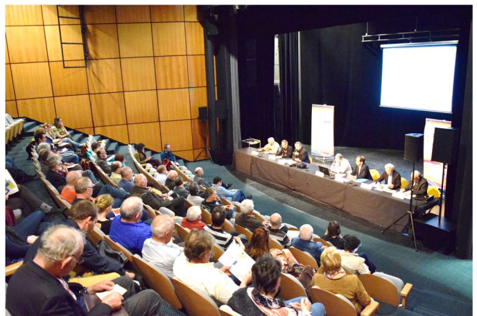
Des participants mobilisés

La mission confiée à E.A.U. et à L'Atelier des Territoires , bureaux d'études en charge de l'élaboration du Schéma de Cohérence Territoriale, a débuté en février dernier. Afin de donner le coup d'envoi de ce projet, une réunion de lancement du SCOT a été organisée le 27 mars 2017. 45 élus et une vingtaine de partenaires ont écouté avec attention la présentation faite par les bureaux d'études en attendant les prochaines réunions de travail.